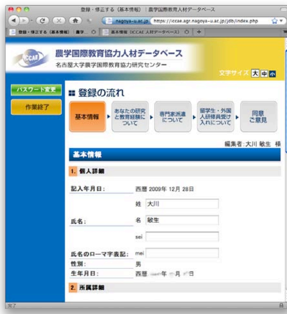
図 3. 書式付き入力フォーム