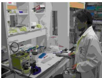
写真 1 2. 線量測定