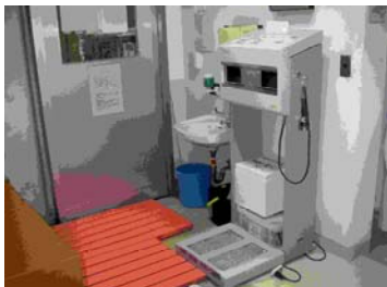
写真5. ハンドフットクロスモニター