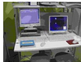
写真 9. R I 使用数量等入力集計システム