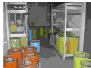
写真 11. 保管廃棄室内の廃棄物ドラム缶