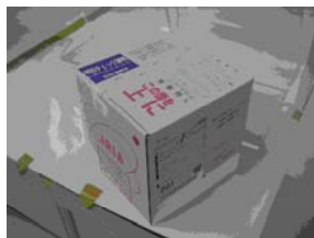
写真 8. 納品時の R I が収納された梱包箱