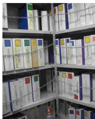
写真15. 保管中の帳簿類