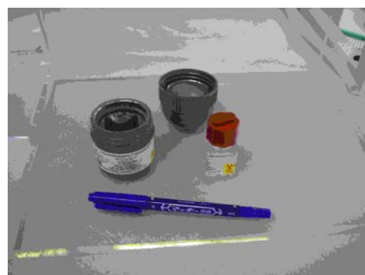
写真4. R I ( 32 P) で標識された化合物（液体）の入ったチューブとバイアルと鉛でシールドされたプラスチック容器。

農学部・生命農学研究科で主に利用される核種は、 32 P、 35 S、 3 H、 14 C、 45 Ca、 33 Pのβ線放出核種と、 125 Iのγ線放出核種である。