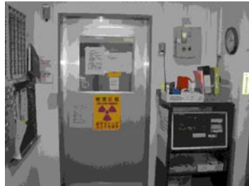
写真6. 非接触カードリーダーによる 入退システムに連動した自動ドア