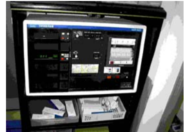
写真7. 放射能監視装置