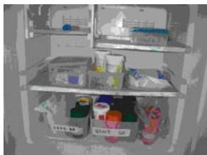
写真 10. 保管中の R I