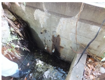
図.10 水槽からの給水