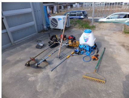
図.3 作業に用いる道具類