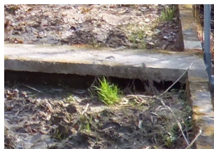
図.6 水田のコンクリート

学内水田は四隅をコンクリートで囲われているので周縁部は機械で耕起できない。そのため、周縁部や四隅、特にコンクリート壁の下の部分（図.6）を備中鋤で耕起する。作業は水田を利用する研究分野での共同作業で行うが、2.1に記載したように備中鋤を振り下ろす時は周囲の人に当たらないように十分に注意するとともに安全配慮について作業者全員に周知するようにする。この作業を行う時に水田北側の給水口に置いてある土嚢が劣化している時は肥料袋に半分程度土をつめて土嚢を作る。また、四隅耕起と同日に（作業者が多くいるときは手分けして行う）水田北側と南側の給水路及び排水路の清掃を行う。冬季に落ち葉が水路にたまっているのでこれを除去し水路に水が流れることを確認する。四隅耕起と同時に行うことができないときは代掻きを行うまでに水路清掃を行うようにする